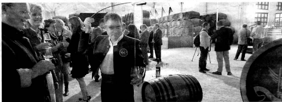
INAUGURACIÓN. La bodega Williams & Humbert presentó ayer en sociedad su nuevo centro de visitas.